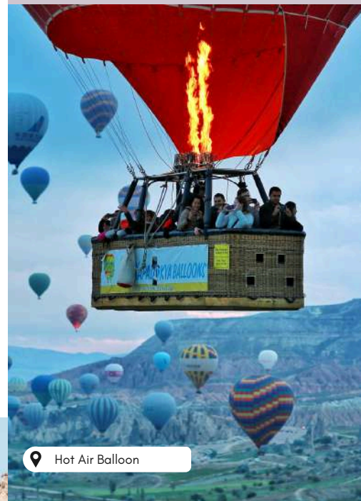
Hot Air Balloon